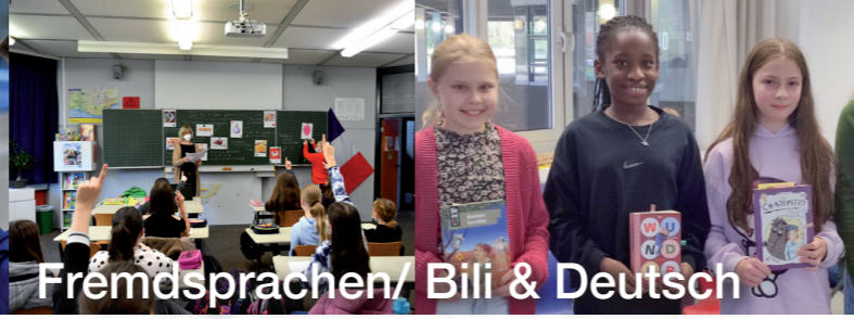
Fremdsprachen/ Bili & Deutsch