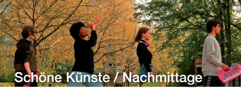
Schöne Künste / Nachmittage