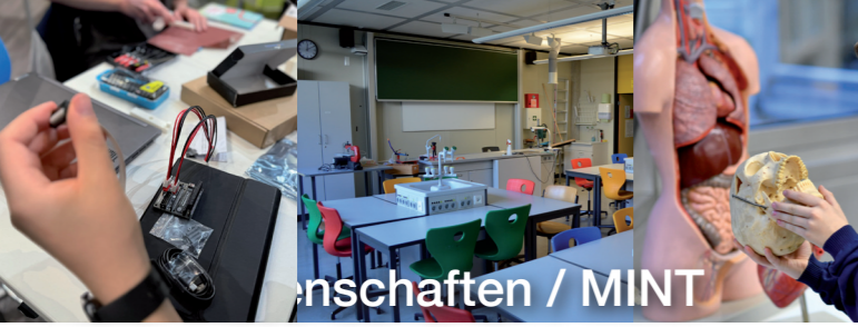
Arbeitsgemeinschaften / MINT