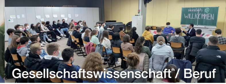
Gesellschaftswissenschaft / Beruf